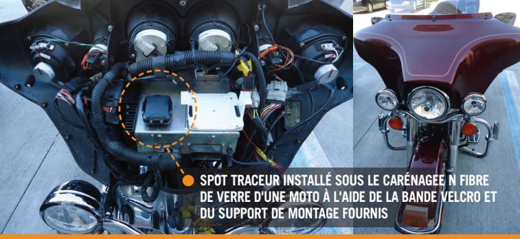
● SPOT TRACEUR INSTALLÉ SOUS LE CARÉNAGE N FIBRE DE VERRE D'UNE MOTO À L'AIDE DE LA BANDE VELCRO ET DU SUPPORT DE MONTAGE FOURNIS